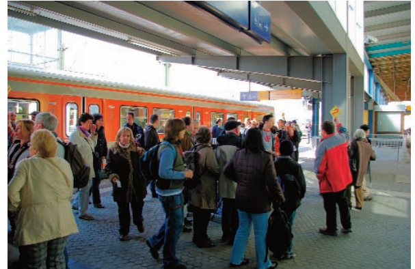
Unsere Stadtführer erwarteten schon die Fahrgäste am Gleis 1.

Bei eher trübem Wetter und mit gut 130 Fahrgästen ging es am 10. April 2010 mit dem ET 420 001 zur Stadtbesichtigung nach Regensburg. Mit einer Pause in Landshut erreichte der Sonderzug kurz vor 11 Uhr den Regensburger Hauptbahnhof bei Sonnenschein. Am Gleis 1 standen schon unsere sechs Stadtführer bereit um die Gruppen in Empfang zu nehmen. Die Führung erfolgte zu Fuß und dauerte mit den Zwischenstopps an z.B. der alten Römermauer oder dem Dom knapp zwei Stunden. Hierbei wurde die Geschichte der über 1800 Jahre alten Stadt erzählt. Mit diesem Alter ist sie zugleich eine der ältesten Städte in Deutschland. Regensburg ist eine kreisfreie Stadt mit etwa