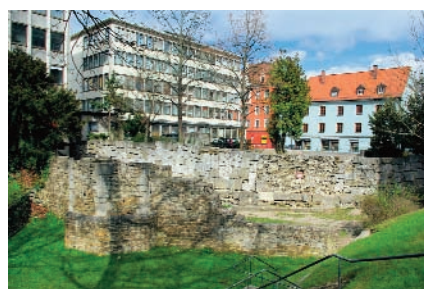
Die alte Regensburger Stadtmauer