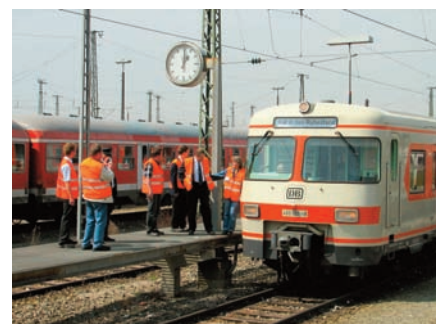
Pasing Bbf