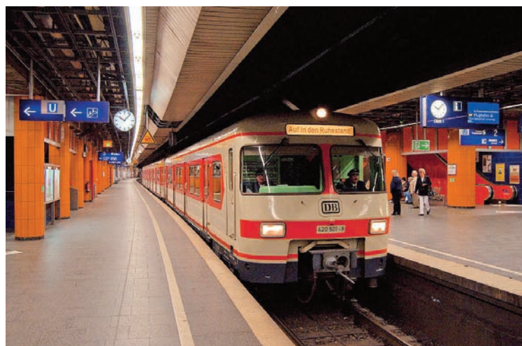
Auf der Ruhestandsfahrt ging es durch den Stammstreckentunnel in Langsamfahrt wie hier am Marienplatz.

Daran denkt man auch, wenn man die letzten Meter fährt. An diesem Sonntag bei schönem Wetter. Vielleicht habe ich das Pfeifen an jedem Bahnhof deswegen als eher wehmütig empfunden. Etwas, woran man sich gewöhnt hatte, hat jetzt erst mal Pause. Die Leute an den Tunnelbahnsteigen waren teilweise verwundert wie auch erfreut bei dem Anblick unseres Zuges. Das hat einige von uns amüsiert.