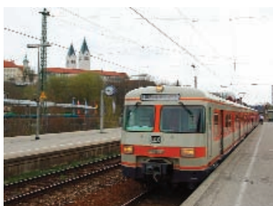
420 001 in Freising

Nach der Stadtführung ging es für etwa eine Stunde mit dem Schiff "Ratispona" auf der Donau weiter. Bei der sogenannten Strudelfahrt fuhren wir flussabwärts bis zur Einmündung des "Umgehungskanals", in diesem weiter bis zur Regensburger Schleuse und via Schwalbelweis zurück zur Anlegestelle. Bis 16 Uhr hatten die Teilnehmer der Fahrt die Zeit zur freien Verfügung. Manche schauten sich weitere Sehenswürdigkeiten der Stadt an, andere gingen zum Essen oder Kaffeetrinken oder auch zum Einkaufen. Um 16.07 Uhr setzte sich 420 001 wieder zur Rückfahrt zum Münchner Ostbahnhof mit einer Pause in Landshut in Bewegung, der gegen 18 Uhr erreicht wurde. (gh)