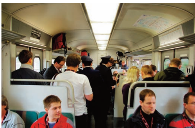
So voll wenn der Zug immer gewesen wäre...

an die 240 Personen wollten sich von unserem ET verabschieden. Sogar ein Kamerteam des Bayerischen Rundfunks begleitete uns. Und so war es diesmal eine andere Atmosphäre als bei den bisherigen Sonderfahrten. Am Ostbahnhof wurden wir von zahlreichen Kameras begrüßt. Es waren deutlich mehr als sonst. Wir freuten uns über viele bekannte Gesichter. Treue Fahrgäste, die an mehreren unserer Sonderfahrten dabei waren. Eisenbahnfreunde und auch Leute, die man auf einer Sonderfahrt oder auch noch nicht gesehen hat oder an die man sich einfach nicht erinnern kann.