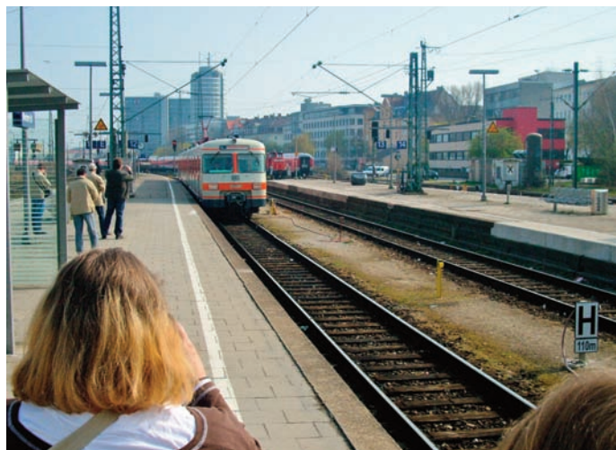
Bei der Bereitstellung am Münchner Ostbahnhof

Die nach derzeitiger Aktenlage (Pressemitteilung) vorletzte Sonderfahrt "unseres" Fahrzeugs fand sechs Tage vor Fristablauf am 17.04.2010 statt. Eingeladen wurde, "wer sich in den letzten Jahren engagiert dafür eingesetzt hatte, dass Sonderfahrten mit dem ET 420 stattfinden konnten bzw. dafür gesorgt hatte, dass das Fahrzeug betriebsbereit war." Werkstattmitarbeiter, Verantwortliche und wir bekamen damit "die Möglichkeit, uns gebührend vom ET 420 001 zu verabschieden."