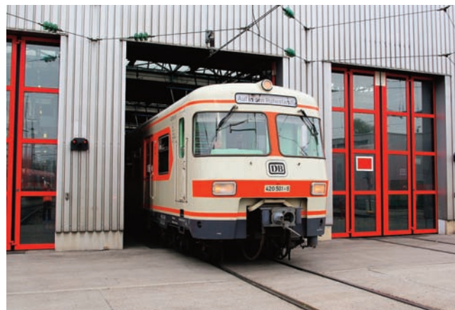
Zur vorerst letzten Fahrt verlässt ET 420 001 die Steinhausener Werkshalle.

So wirklich wussten wir wohl nicht, wie es uns zumute ist an diesem Sonntag, an dem der ET420 001 das Letzte Mal fahren sollte. Das letzte Mal vor der anstehenden Hauptuntersuchung. Ob er sie erhält oder nicht, wussten und wissen wir noch nicht. Damit besteht aber immer noch Hoffnung auf eine Lösung, um die sich auch die S-Bahn bemüht. Um 9 Uhr ging es los mit dem Treffen am Keller in Steinhausen, wie am Tag zuvor später als bei den meisten anderen Sonderfahrten. Viele Fahrgäste wurden erwartet,