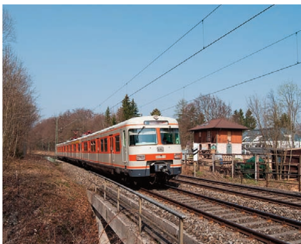
Kurz nach der Großhesseloher Brücke

Etwas später als gewöhnlich ging es zunächst einmal wieder "um den Kirchturm" über Englschalking, Milbertshofen, Rangierbahnhof, die Lärmschutzwände von Allach, Laim Rangierbahnhof bis zum Heimeranplatz, dann weiter über Solln und Deisenhofen nach Holzkirchen mit den Höhepunkten