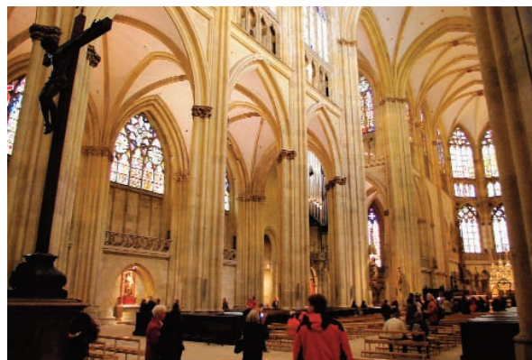
Eine der Sehenswürdigkeiten ist der Regensburger Dom.

133.500 Einwohnern und zugleich Sitz der Regierung von der Oberpfalz. Daneben ist sie auch Bischofssitz der römisch-katholischen Diözese Regensburg. Nach München,