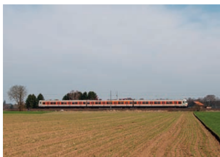
Bei Deisenhofen

Anzumerken ist, dass der ET 420 001 seit kurzem ein bewegliches Denkmal des Freistaates Bayern ist und eine Verschrottung somit ausgeschlossen ist. (sg)