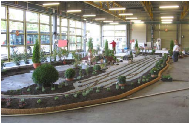
Die Gartenbahnanlage in der Bushalle. Modell und Originaldampfwalzen im Busbetriebshof in Fürth.