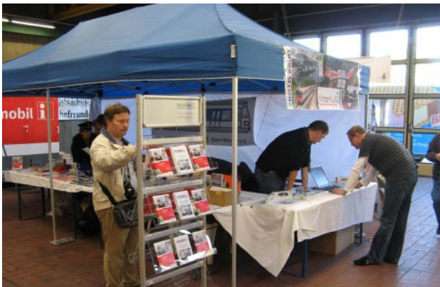
Unser Stand, mit dabei war diesmal der Nahverker Franken. V36 235, V60 11011 und 184 003 bei der Ausstellung.