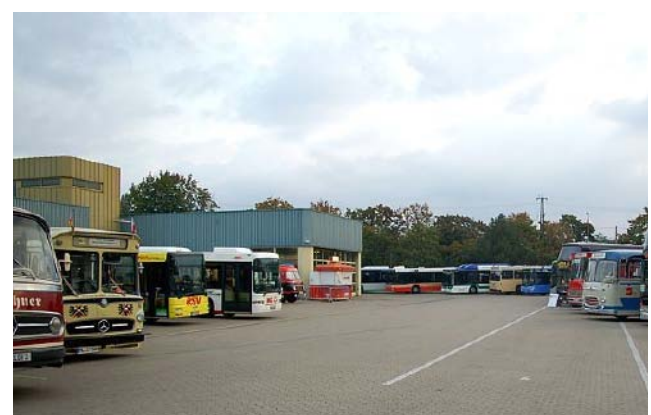
Überblick der im Betriebshof Fürth der Infra ausgestellten Busse.