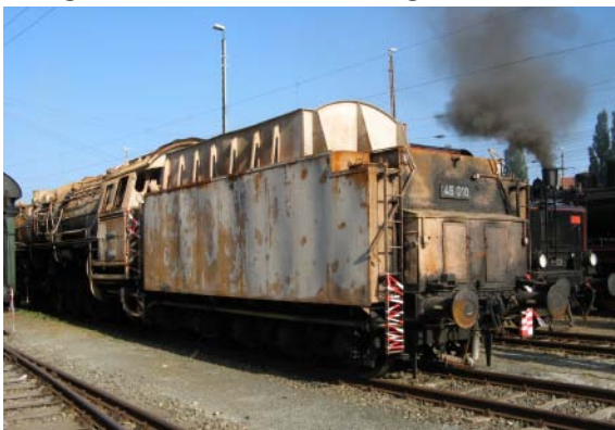
Die bei dem Brand im Lokschuppen des DB Museums abgebrannte 45 010.

auf Fürther Stadtgebiet an beiden Tagen kostenfrei benutzt werden.