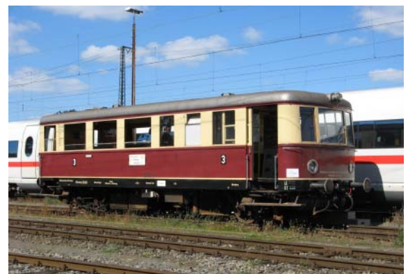
VT 135 069 "Nürnberg", dahinter 403 024 "Fürth"

Mein persönliches Highlight war am Samstag, als ich am Zug eingeteilt war. Plötzlich wurde mir ein großes Objektiv unter die Nase gehalten und der Fotograf dahinter fragte mich, ob er ein Bild von mir machen dürfte. Ich konnte so schnell garnicht antworten, da waren die Bilder schon gemacht und der Fotograf wieder weg. So wusste ich nicht, wo und wann überhaupt das Bild