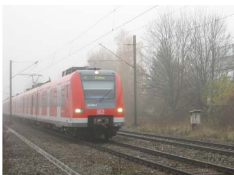
Laub und Nebel lassen den 423 gerne mal ins Rutschen kommen.

Natürlich hat dies auch Folgen für den Fahrplan, der etwas aus den Fugen geraten ist, da Verspätungen nun nicht mehr so leicht aufgeholt werden können. Zusätzlich zu der EBA-Anordnung kommt bei der Münchner S-Bahn die Sogenannte