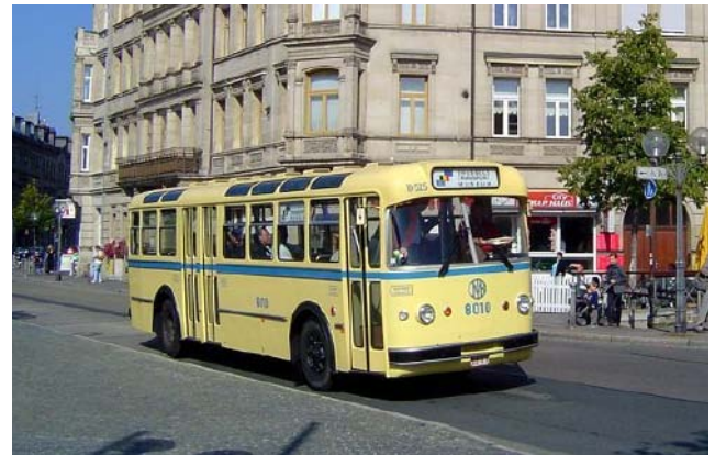
Aus Belgien stammt dieser Büssing 6500 T. Hier ist er am Fürther Hauptbahnhof zu sehen.