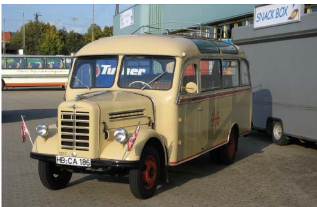
Von der Bremer Straßenbahn war der Borgward B 1500 D zu Gast.