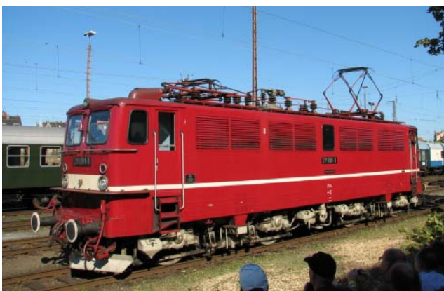
Auch die DR-E-Lok 221 001 nahm an der Parade teil.