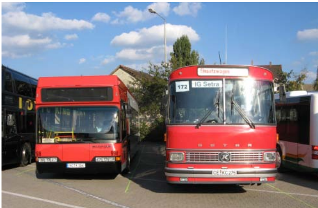
Neoplan N 4114 DE der VAG und Setra Gelenkbus der DB.