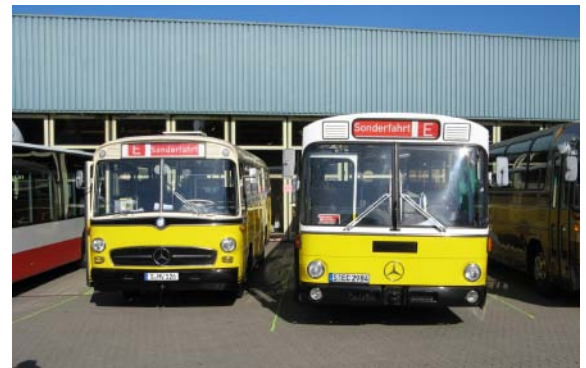
Aus Stuttgart waren diese beiden Mercedes-Omnibusse in Fürth zu Gast.

Schienenbusse sowie der ET 420 001 zugegen. Am Samstag wurde zusätzlich noch ein Triebzug des Typs "ICE 3" auf den Namen Fürth getauft. Nachdem es sich bei dieser Veranstaltung aber nicht nur um die Eisenbahn drehte, durften die historischen und modernen Busse nicht fehlen. Um den Rahmen hier nicht zu sprengen, können leider nicht alle Busse aufgezählt werden. Stellvertretend sei hier erwähnt: Büssing "Schnauzenbus" VI GLn 28 Baujahr 1929 aus Düsseldorf als ältester Bus der Ausstellung, Henschel HS 160 OSL als sehr selten erhaltener Bus, Neoplan Doppelstock-Gelenkbus als "der größte" sowie zahlreiche moderne Busse z. T. mit Busanhänger. Der neueste ausgestellte Bus war ein MAN Lion's City G der MVG bzw. ein Lion's City der Rheinbahn aus dem Jahr 2007. Teilweise fuhren die ausgestellten Busse an diesem Wochenende im normalen Fürther Linienbetrieb mit, was für ein recht buntes Treiben auf den Straßen sorgte. Für einen obligatorischen Spenden-Euro konnten die Busse und die U-Bahn