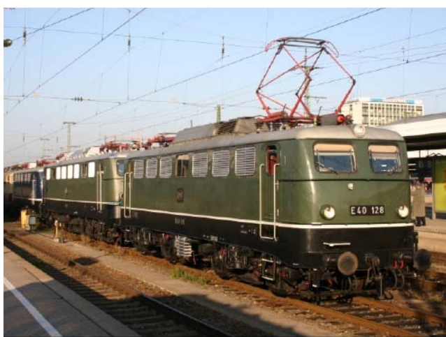
Lokzug mit E40 128 und vielen weiteren Ausstellungsobjekten. 03 1010 rangiert auf dem Ausstellungsgelände im Fürther Gbf.