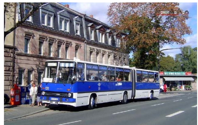
Aus Cottbus war der Ikarus 280.03 im Linieneinsatz.