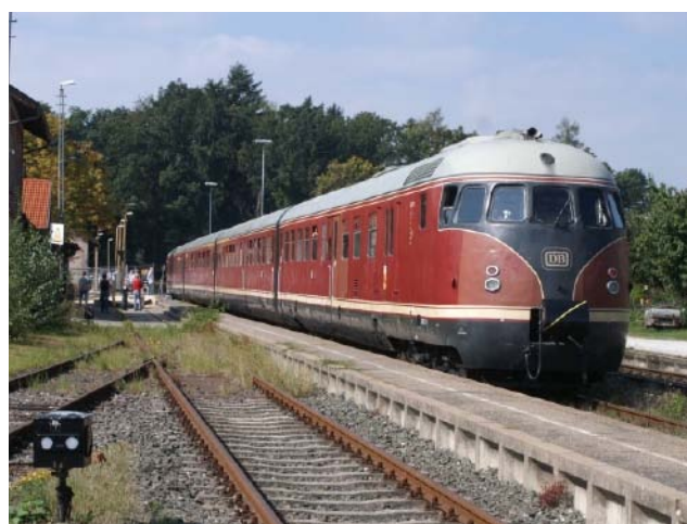
Das "Stuttgarter Rössle" pendelte auf der Strecke Fürth - Cadolzburg. Die "Ferkeltaxen" fahren zwischen Fürth Hbf und N-Nordost.