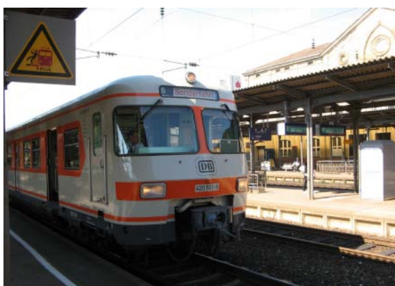
ET 420 001 bei der Ankunft in Fürth Hauptbahnhof.

Los ging unsere Reise schon am Freitag Vormittag. Die Fahrt nach Fürth stand anfänglich leider unter keinem guten Stern. So erfuhren wir erst ganz knapp vor der planmäßigen Abfahrt in Steinhausen, dass der ET 420 001 doch noch genügend Kilometer bis zur nächsten Inspektion frei hat, um nach Fürth und wieder zurück