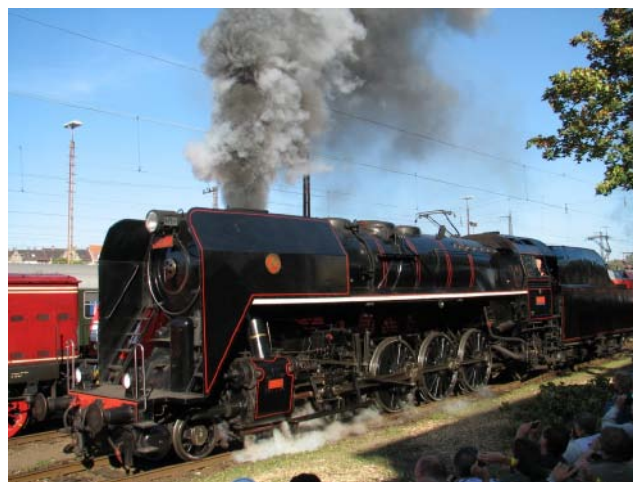
Die tschechische Dampflokomotive 475.111 "Plzen" bei der Parade.