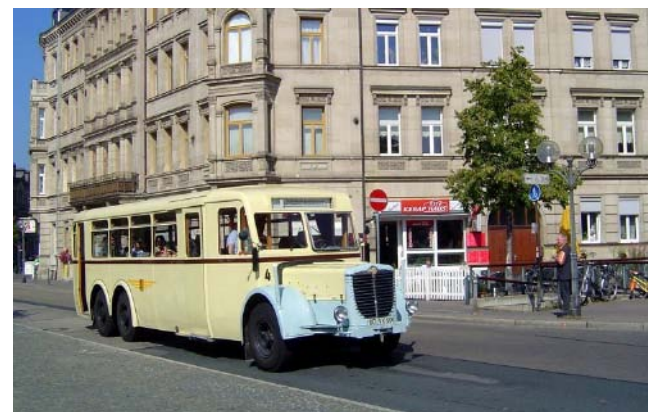
Der Büssing NAG 900 N am Fürther Hauptbahnhof.