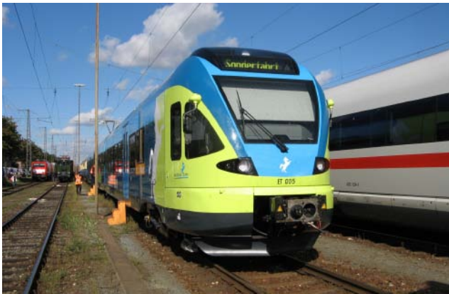
Von der Westfalenbahn war der ET 005 ("FLIRT") ausgestellt.