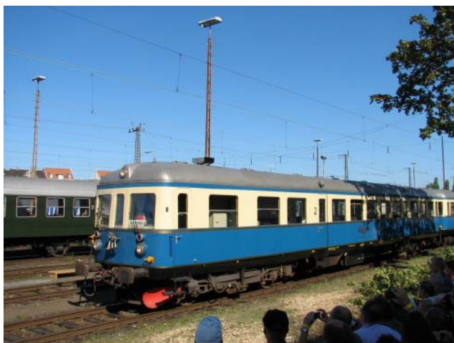
VT 07 und VS 28 der Regentalbahn bei der Fahrzeugparade.

Hier noch einige Bilder von der Jubiläumsfeier: