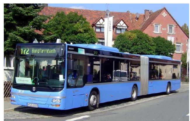
MAN Lions City G der MVG als Linie 172 nach Burgfarnbach an der Haltestelle Unterburgfarnbach Schule.