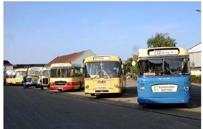
Überblick der im Betriebshof Fürth der Infra ausgestellten Busse.