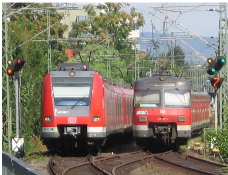
Während auf der S5 schon der ET 423 im Einsatz ist, wird die S3 noch mit ET 420 betrieben. Hier begegnen sich zwei S-Bahngenerationen am 19.08.06 bei Frankfurt-Rödelheim.