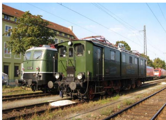
E50 091 und E77 10 auf dem Ausstellungsgelände in Fürth Rangierbahnhof.

Für die Triebwagen waren stellvertretend VT 132 (DRG), VT 772 (DR), ein Integral der BOB, ein FLIRT der Westfalenbahn, VT07 und VS 28 der Regentalbahn,