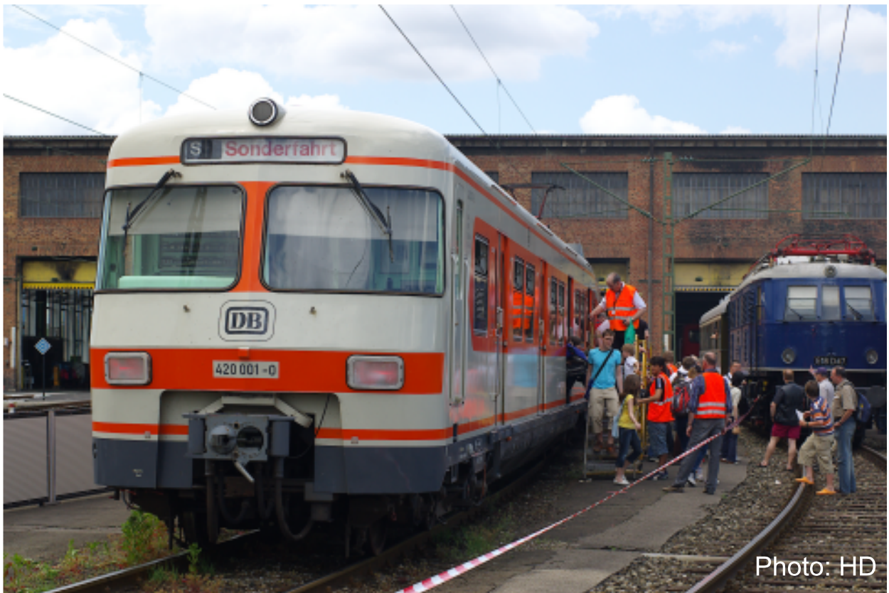
Reger Andrang herrschte bei den Pendelfahrten zum Hauptbahnhof