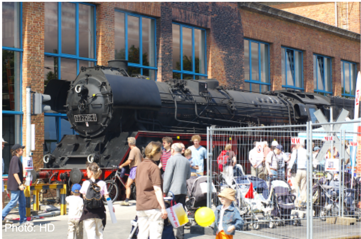
Der Star von vielen Besuchern, die 03 2295