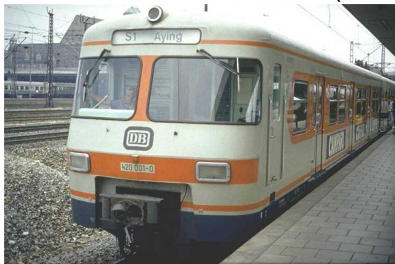
(420001 an der Donnersbergerbrücke, 1977, Slg.)